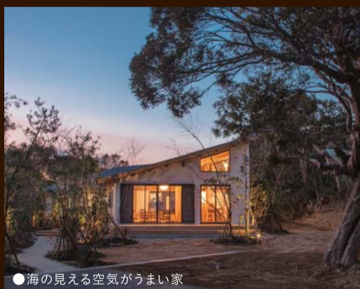
●海が見える空気がうまい家

創業100年 住む人の気持ちを大切にしたい家づくり 弊社は『全従業員の物心両面の幸福を追求すると共に、建築技術進歩の発展を通じて社会貢献をする』を企業理念に掲げております。お客様はもちろんのこと、従業員、協力業者、弊社に関わる全ての皆様の物心両面の幸福のために、住まれるお客様が安全に、安心して住める、お客様の財産を守るような建物造りを心がけております。 これからも、創業100年という歴史ある看板の名に恥じない企業経営を続けてまいります。