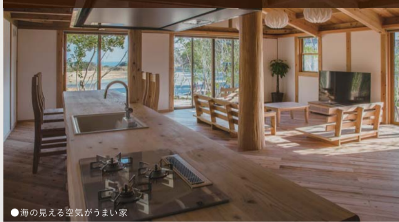
●海が見える空気がうまい家