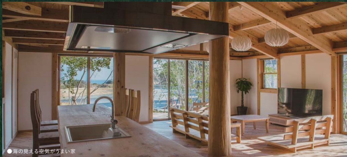
●海見える空気がうまい家

こだわりぬいた健康自然建材でつくる空気がうまい家®のクオリティは、その空間に一步足を踏み入るとご実感いただけます。