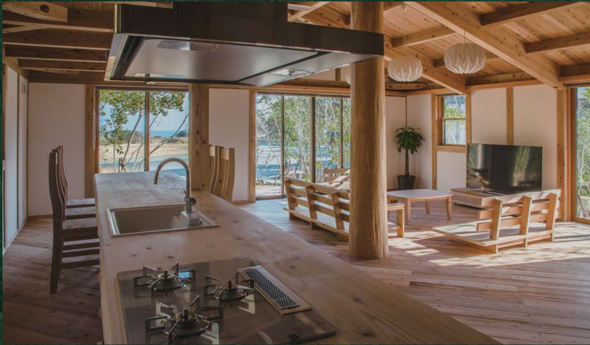
●海が見える空気がうまい家

こだわりぬいた健康自然建材でつくる空気がうまい家®のクオリティは、その空間に一步足を踏み入るとご実感いただけます。