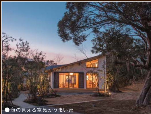
●海が見える空気がうまい家