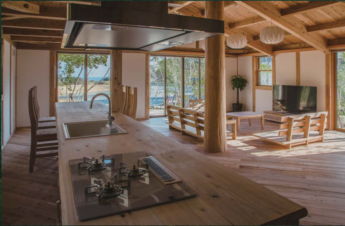
●海が見える空気がうまい家

こだわりぬいた健康自然建材でつくる空気がうまい家®のクオリティは、その空間に一步足を踏み入れるとご実感いただけます。