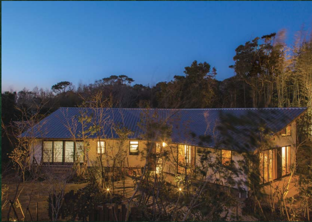
●海が見える空気がうまい家

こだわりぬいた健康自然建材でつくる空気がうまい家®のクオリティは、その空間に一步足を踏み入るとご実感いただけます。