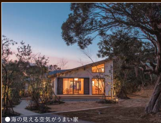
●海が見える空気がうまい家