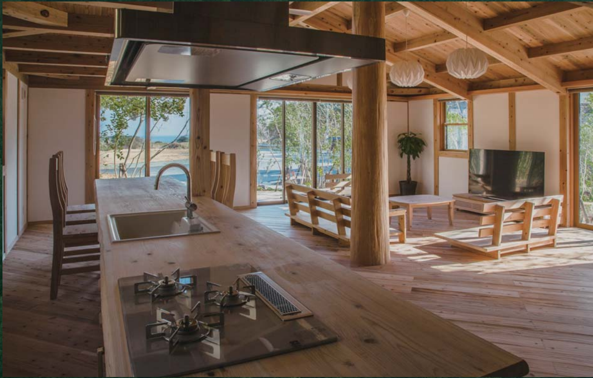
●海が見える空気がうまい家

こだわりぬいた健康自然建材でつくる空気がうまい家®のクオリティは、その空間に一步足を踏み入れるとご実感いただけます。