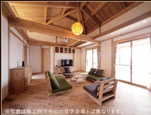
※写真は施工例で今回の見学会場とは異なります。