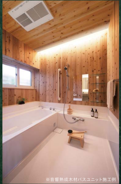
※音響熟成木材バスユニット施工例