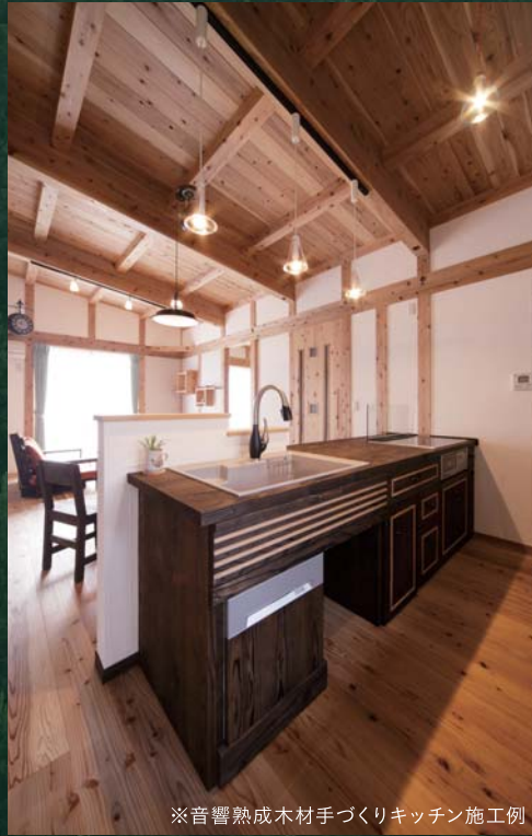
※音響熟成木材手づくりキッチン施工例