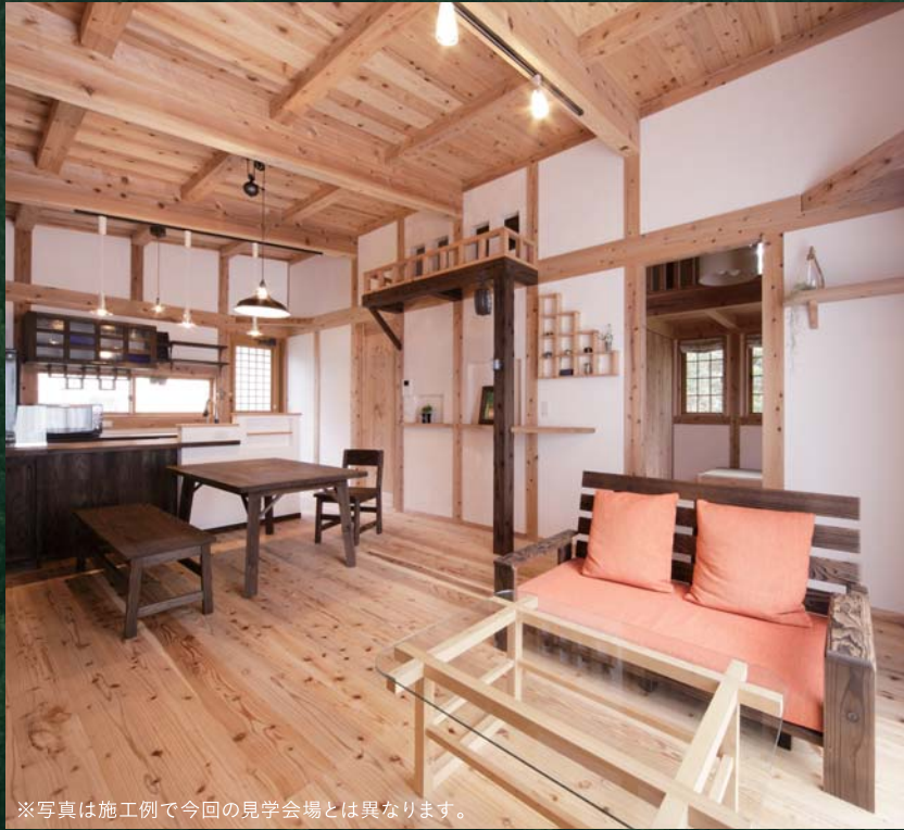
※写真は施工例で今回の見学会場とは異なります。

こだわりぬいた健康自然建材でつくる空気がうまい家 ® のクオリティは、その空間に一步足を踏み入るとご実感いただけます。