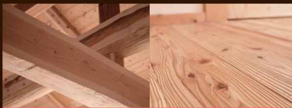
構造用合板を使用せず耐震等級3を実現