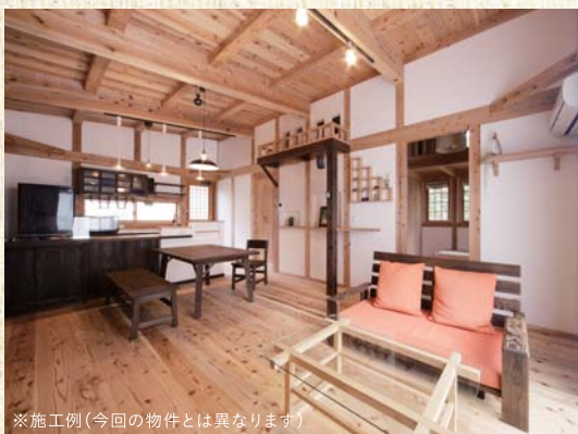
※施工例(今回の物件とは異なります)

さらに「幻の漆喰®」「幻の漆喰®ピュアケアウォール®」と「清活畳®」で住むほどに心地いい健康住宅に