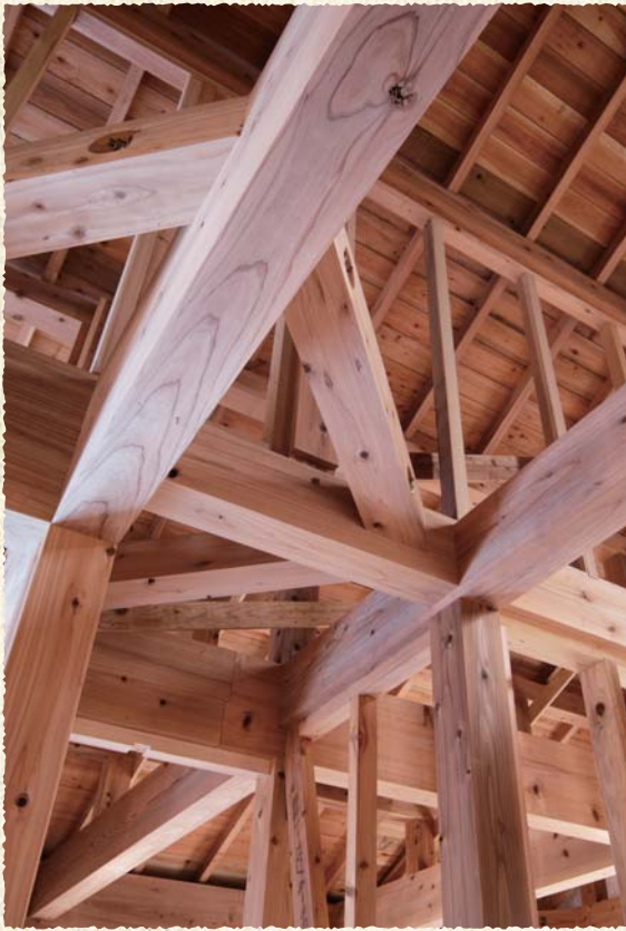
※写真は施工例で、今回の物件とは異なります。

●こだわりぬいた健康自然建材でつくるその構造を、完成前の貴重な見学会でお確かめください。