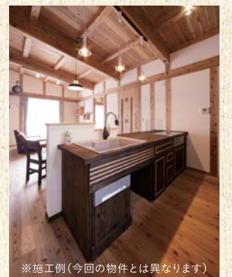
※施工例(今回の物件とは異なります)

6畳2間でドラム缶1本分の竹炭入り。い草の香りと共にさわやかで清々しい住空間に。