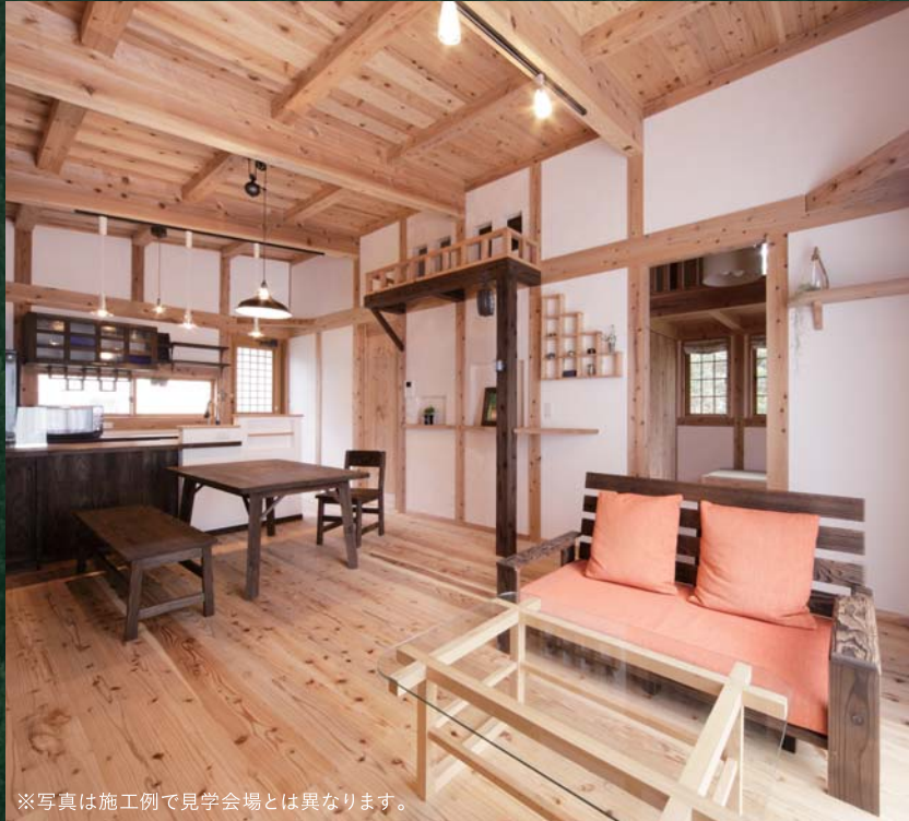
※写真は施工例で見学会場とは異なります。

こだわりぬいた健康自然建材でつくる空気がうまい家®のクオリティは、その空間に一歩足を踏み入るとご実感いただけます。